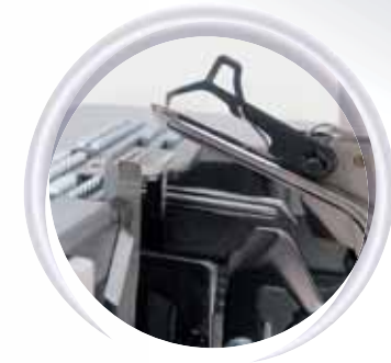
Stevige grijperkanalen met inklapbare hulpgrijper

Optimaal naairesultaat met allerlei stoffen