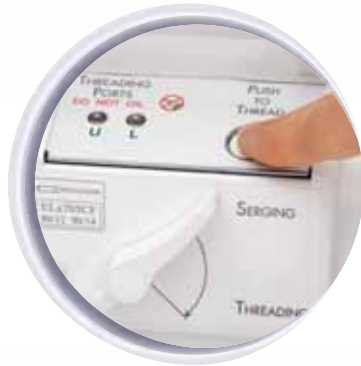
ExtraordinAir™ Threading System