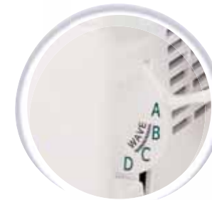
Selectie van de naad