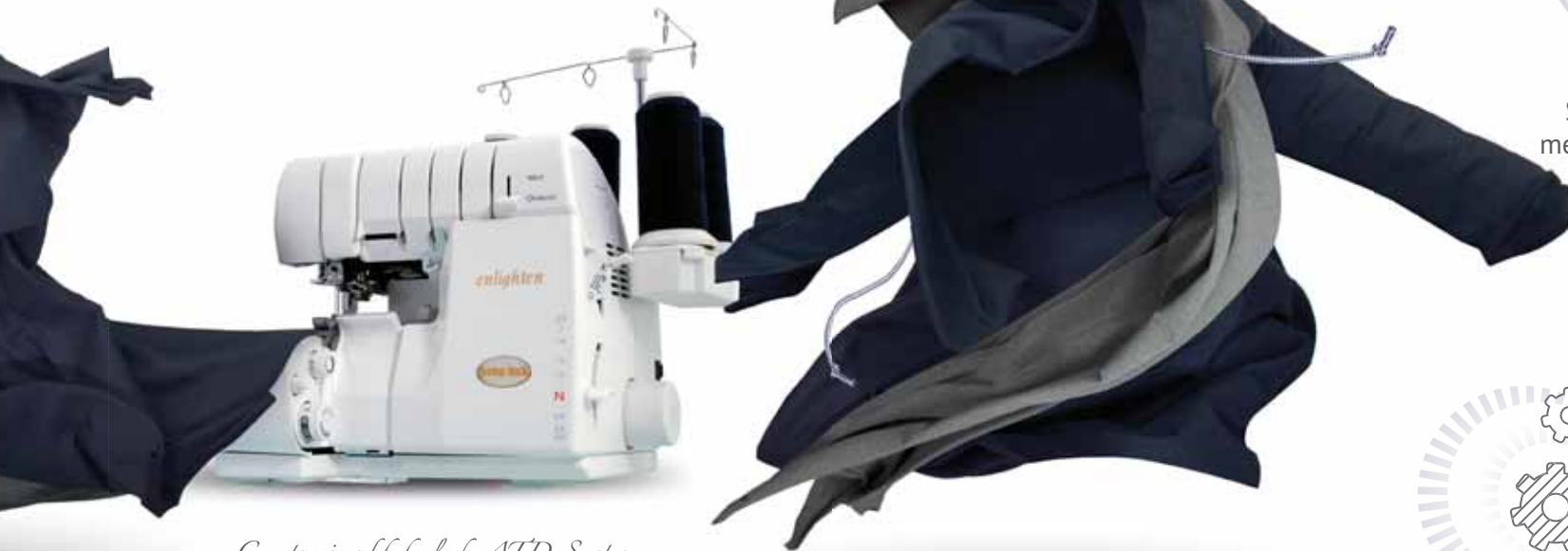
Geectrooieerd baby lock ATD-System