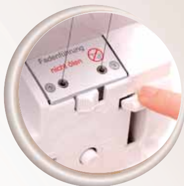
Jet-Air Threading™ System