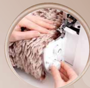
Overzichtelijke indeling van de instelregelaars