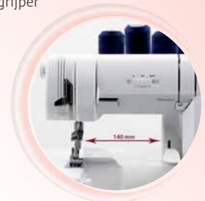
Snelheidsregeling en extra brede doorlaat