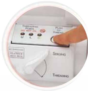
ExtraordinAir™ Threading System in 2009 door baby lock ontwikkeld