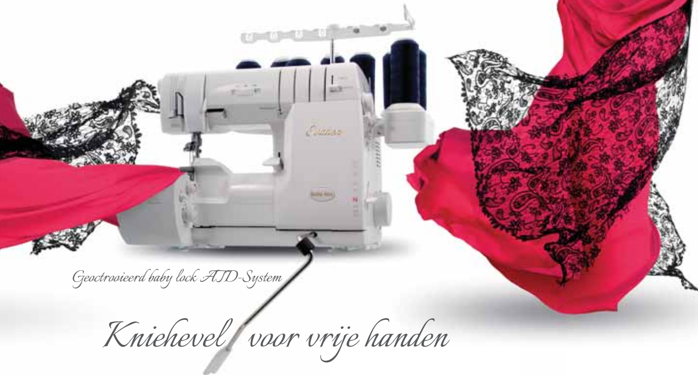
Geotrooveerd baby lock AFD-System

Optimaal naairesultaat met allerlei stoffen