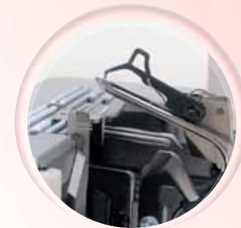
Stevige grijperkanalen met inklapbare hulprijper