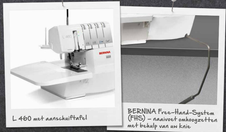
L 460 met aanschuiftafel

Het goed verlichte grote werkoppervlak van deze overlocker vereenvoudigt het naaien en het inrijgen van grijpers en naalden. Dankzij het Free-Hand-System (FHS), dat de naaivoet omhoog en omlaag zet, zijn beide handen vrij voor het naaien en het plaatsen van de stof. De aanschuiftafel vergroot het werkoppervlak en vergemakkelijkt het verwerken van grote naaiprojecten.