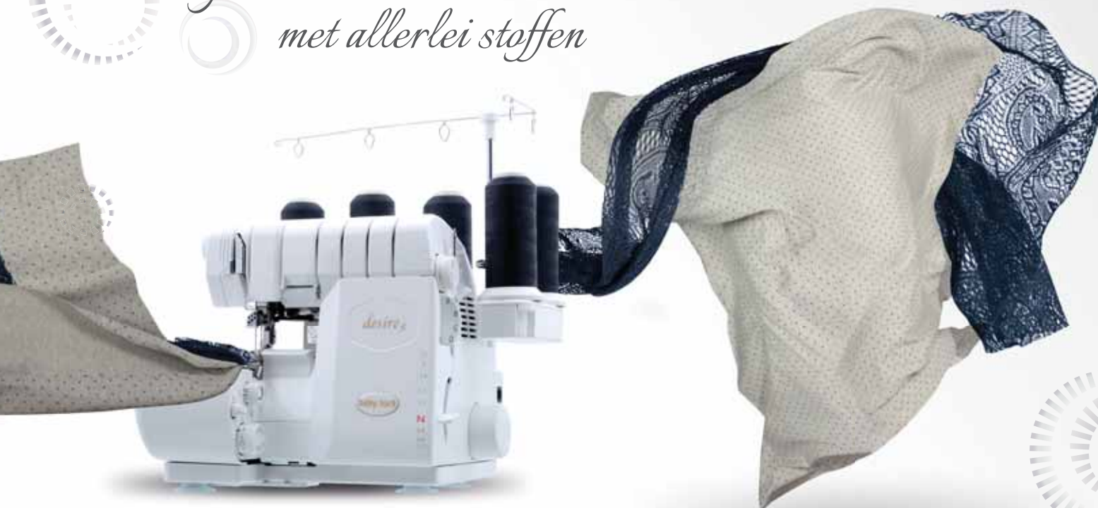
Geëlectriceerd baby lock ATD-System