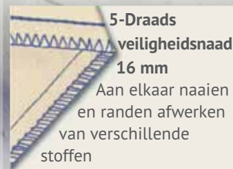
5-Draads veiligheidsnaad 16 mm

Aan elkaar naaien en randen afwerken van verschillende stoffen