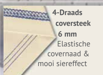
4-Draads coversteek 6 mm