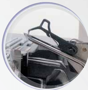
Stevige grijperkanalen met inklapbare hulpgrijper