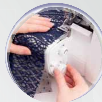
Overzichtelijke indeling van de instelregelaar

Optimaal naairesultaat met allerlei stoffen