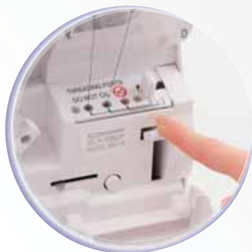
Jet-Air Threading™ System in 1993 door baby lock ontwikkeld