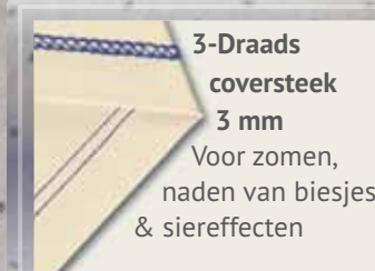
3-Draads coversteek 3 mm

Voor zomen, naden van biesjes & siereffecten