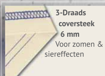
3-Draads coversteek 6 mm