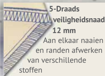
5-Draads veiligheidsnaad 12 mm

Aan elkaar naaien en randen afwerken van verschillende stoffen