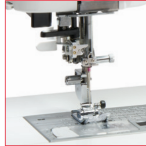
Superieure naaldinrijger & verbeterde naaiveldweergave