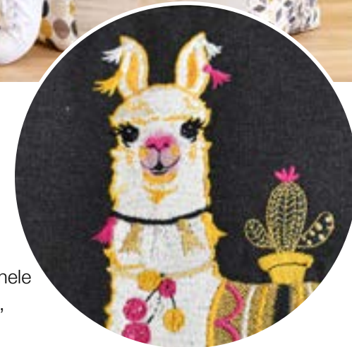
Inclusief veel originele borduur-, quilt- en omrandingspatronen