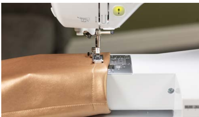
De vrije arm - fijn om mouwen en andere tubulaire projecten te naaien.