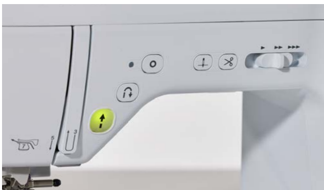
Veelgebruikte functies - centraal geplaatst op de machine