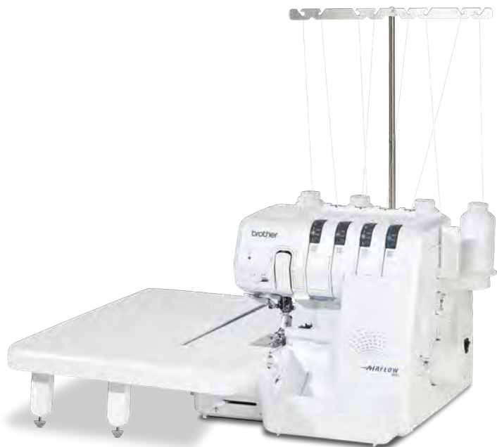
Grote verlengtafel - voor perfecte ondersteuning. (afzonderlijk verkrijgbaar)