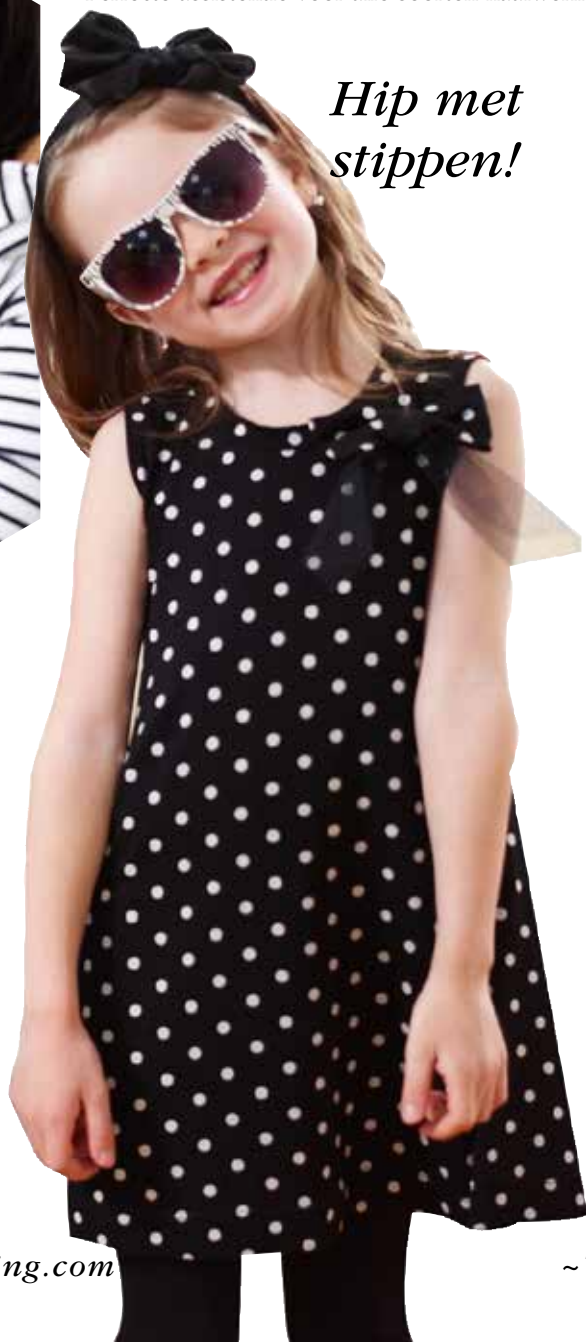
De zwart-witte stippenjurk is gemaakt van elastische stof met elastische steken.

Neem wat goede raad aan van uw naaimachine! Voer het type stof en de naaitechniek die u gebruikt in en de exclusieve SEWING ADVISOR® functie stelt de machine onmiddellijk voor u in. De functie selecteert de beste steek, steekbreedte, steeklengte en naaisnelheid. Ook worden aanbevelingen voor andere instellingen gegeven. De OPAL™ 690Q en 670 stellen ook de beste draadspanning voor u in, terwijl deze op de OPAL™ 650 wordt aanbevolen.